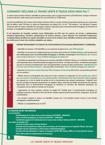
LA TRAME VERTE ET BLEUE VENTOUX