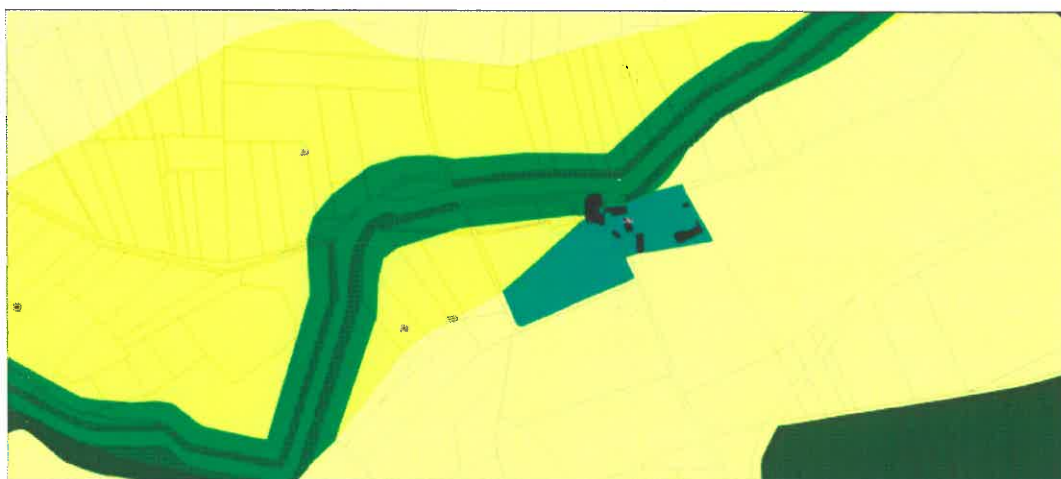
Le site après modification

Une évolution du zonage en zone N avec le STECAL Am de 0,72 ha pour prendre en compte les besoins de (mise aux normes PMR et extension mesurée):